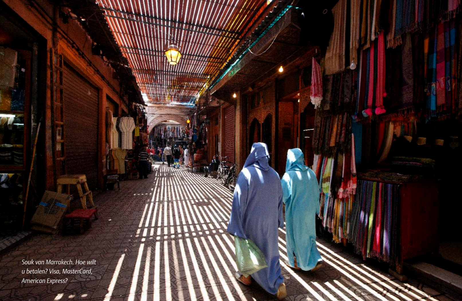
Souk van Marrakech. Hoe wilt u betalen? Visa, MasterCard, American Express?