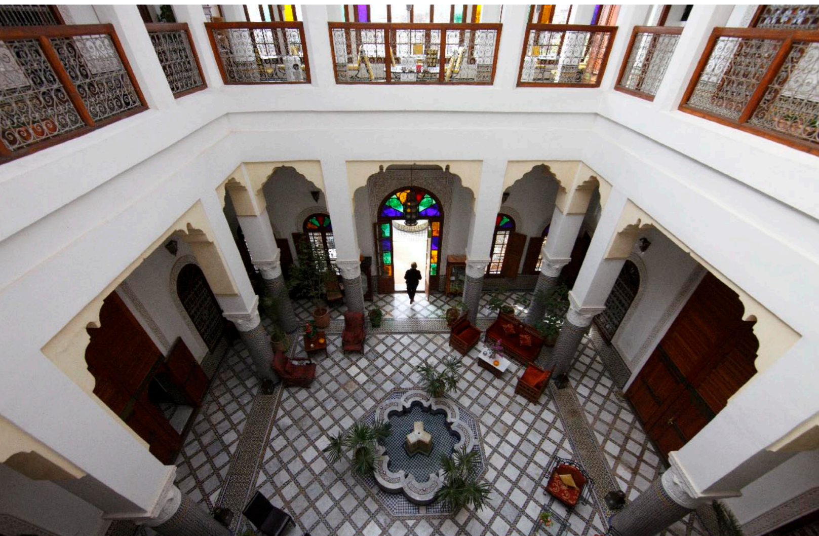
Riad Mabrouka, vol mozaïeken en Arabische kunst. Oui-oui, hier willen we wel slapen.

Afdingen? Mooi om naar te kijken, waardeloos om zelf te doen. Ik kan het gewoon niet. Met een stalen gezicht zielig doen, praten als Brugman en uiteindelijk krijgt de Marokkaan zijn zin. 'No cash?' Daar verschijnt de pinautomaat 'Visa, MasterCard, American Express?'