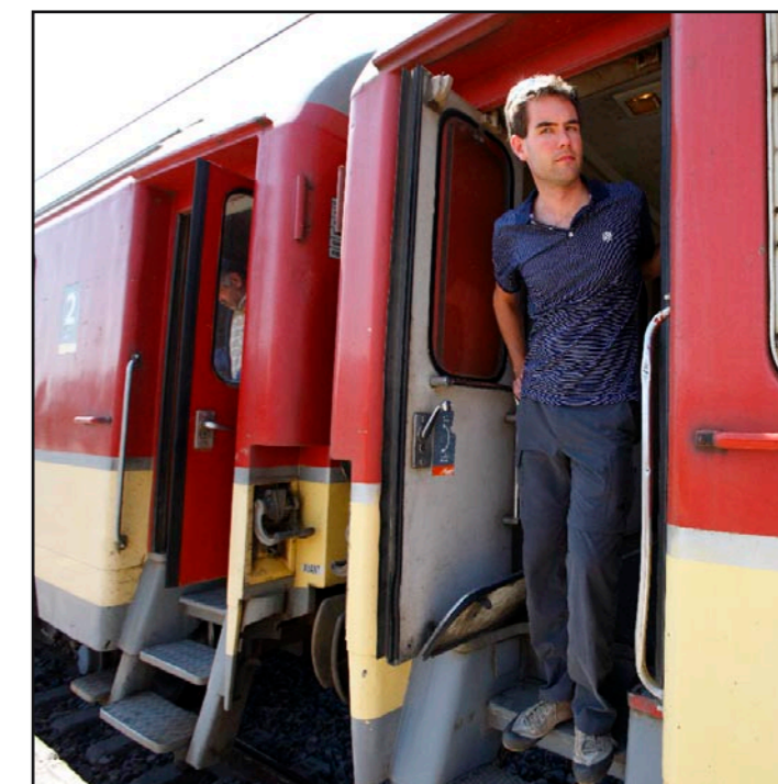
OP REPORTAGE... REDACTEUR MATTHIJS DE WINTER ‘Treinen door Marokko is verbazingwekkend simpel, comfortabel en veilig. Wellicht zelfs teleurstellend modern voor een romanticus met de Oriënt-Express in het hoofd en Paul Theroux in de koffer, maar wel dé manier om je efficiënt tussen de koningssteden te verplaatsen. Het mooiste traject ligt richting Marrakech. Daar voel je nog de cadans van wegzakkende bielzen in het woestijnzand.’

Als je ruim in de tijd zit, stap dan op weg naar Rabat uit op het station van Meknès. Voor deze koningsstad, met de bijnaam ‘het Versailles van Marokko’, heb je aan twee dagen genoeg. De stad is rustiger dan Fès en minder platgelopen dan Marrakech. Bovendien is het een mooie uitvalsbasis voor een dagtocht naar de mooiste Romeinse stad in Marokko, Volubilis. Als je moskeemoe bent en de drukke soeks je naar de keel grijpen, kun je hier weer even adem halen bij de vertrouwde krulzuilen, tempels en beelden. Zie ook www.sitedevolubilis.com .